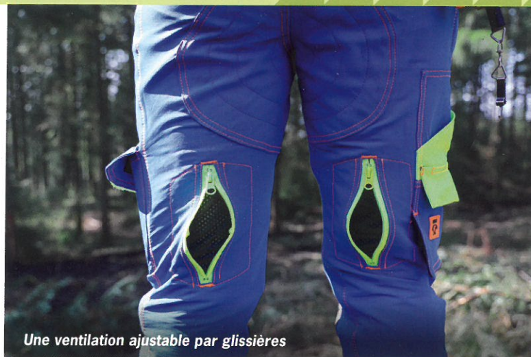
Une ventilation ajustable par glissières