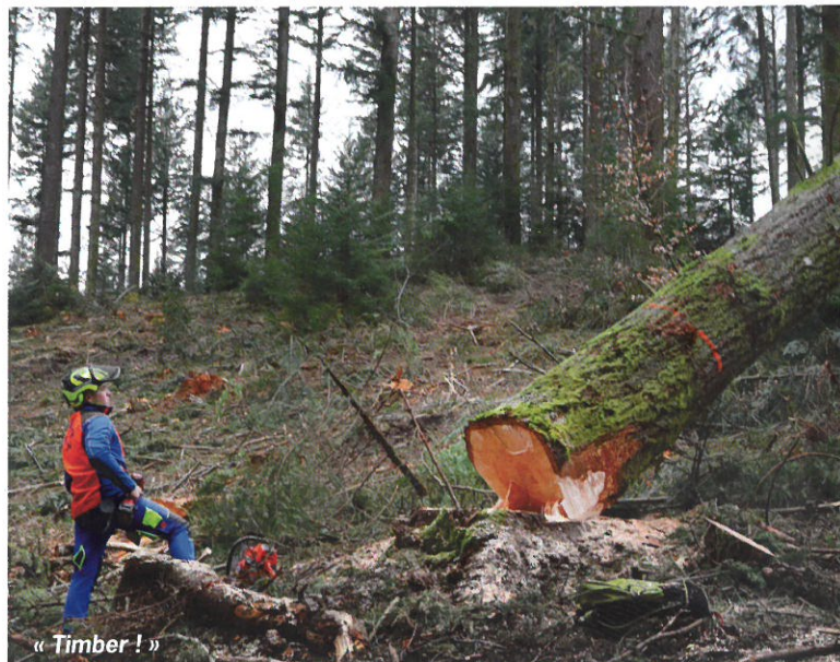
« Timber ! »