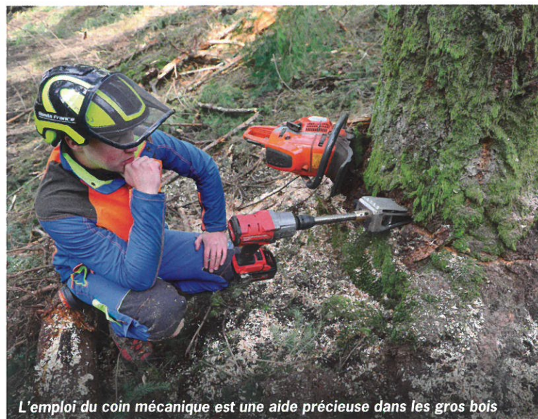
L'emploi du coin mécanique est une aide précieuse dans les gros bois

Il estime en effet que le poids est très uniformément réparti ce qui renforce encore davantage l'impression de légèreté. La protection se compos