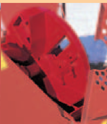
HJ 5 disque à couteaux