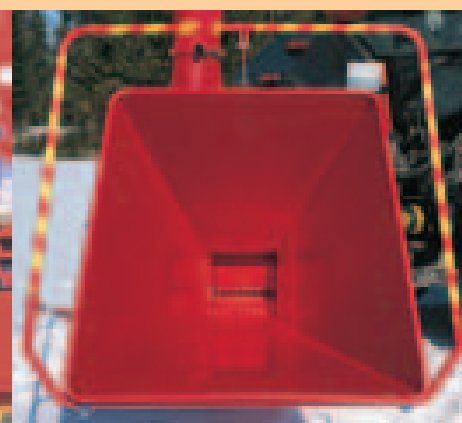
HJ 10 Trémie d'alimentation hydraulique

La dimension des plaquettes obtenues avec les déchiqueteuses Junkkari peut se régler selon les besoins. La qualité de ces plaquettes est régulière et le travail, même en conditions difficiles, est sécuritaire.