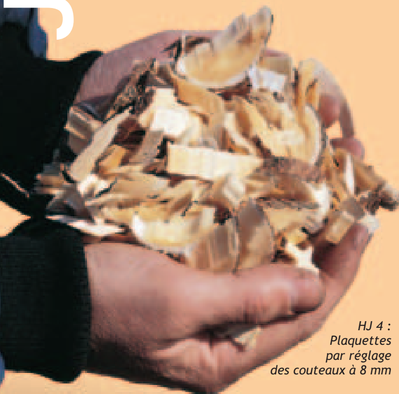
HJ 4 : Plaquettes par réglage des couteaux à 8 mm

Le disque de fragmentation est équipé d'ailettes de soufflage permettant une dispersion efficace des plaquettes dans la nature. La goulotte d'évacuation orientable et sa chicane de guidage permettent le chargement direct des plaquettes dans une remorque ou sur un camion.