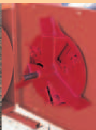
HJ 4 disque à couteaux