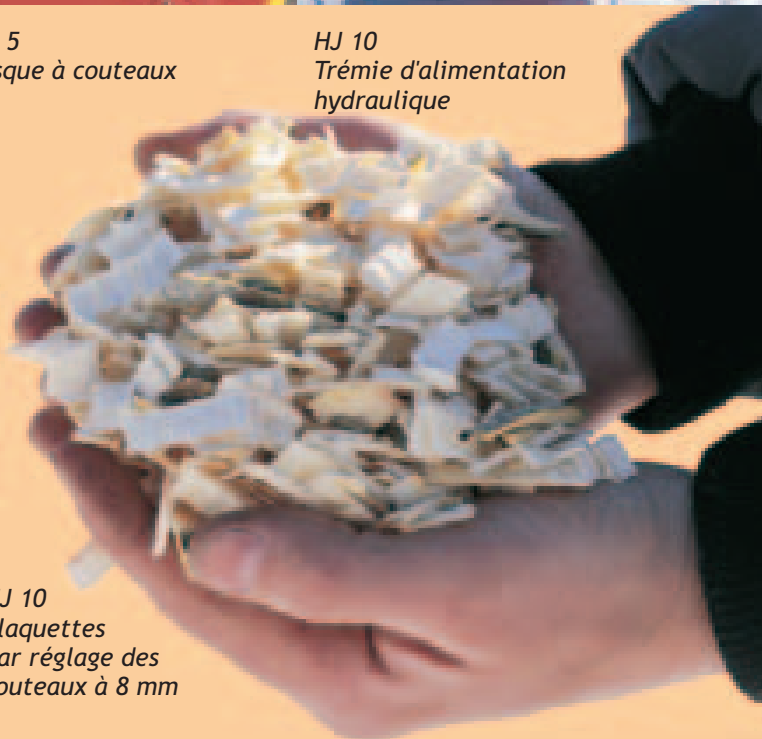
HJ 10 Plaquettes par réglage des couteaux à 8 mm

La dimension des plaquettes obtenues avec les déchiqueteuses Junkkari peut se régler selon les besoins. La qualité de ces plaquettes est régulière et le travail, même en conditions difficiles, est sécuritaire.