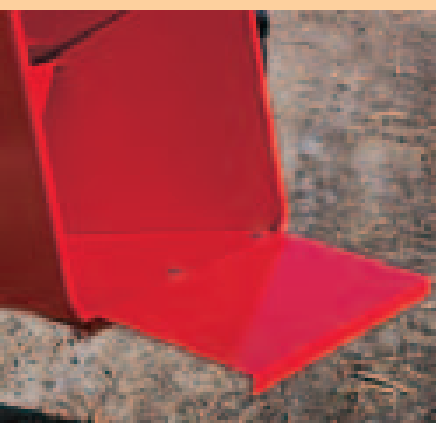
HJ 4 M extension de la goulotte